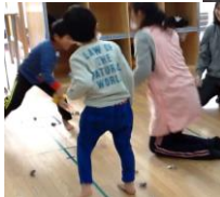
節分 鬼の製作 豆まき