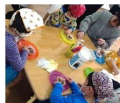
バレンタイン クッキング