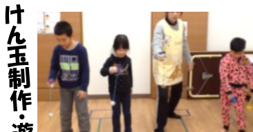
けん玉制作・遊び