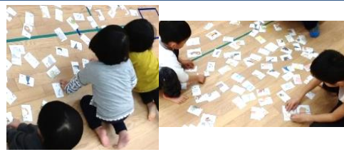
絵合わせ 年長組対年少組 どっちが早いかな?